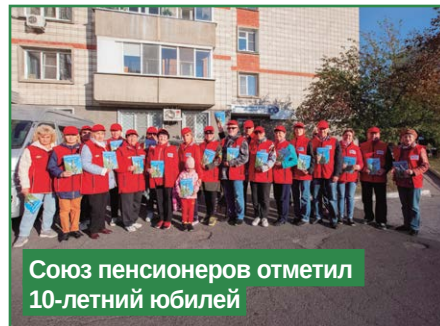
Союз пенсионеров отметил 10-летний юбилей