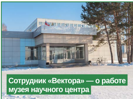
Сотрудник «Вектора» — о работе музея научного центра