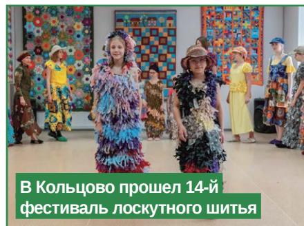
В Кольцово прошел 14-й фестиваль лоскутного шитья