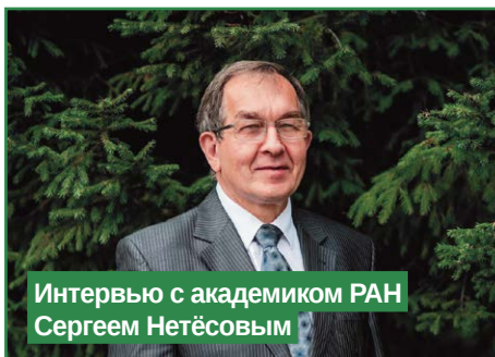
Интервью с академиком РАН Сергеем Нетёсовым