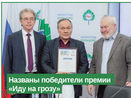
Названы победители премии «Иду на грозу»