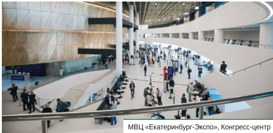
МВЦ «Екатеринбург-Экспо», Конгресс-центр

В течение двух дней более 500 участников — представители различных уровней публичной власти, институтов развития, экспертных организаций, бизнес-сообществ, а также ведущих экспертов и ученых — обсуждали экономику новой реальности, оценивали уроки, получен-