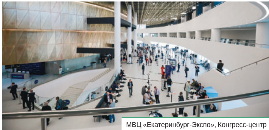
МВЦ «Екатеринбург-Экспо», Конгресс-центр

В течение двух дней более 500 участников — представители различных уровней публичной власти, институтов развития, экспертных организаций, бизнес-сообществ, а также ведущие эксперты и ученые — обсуждали экономику новой реальности, оценивали уроки, получен-